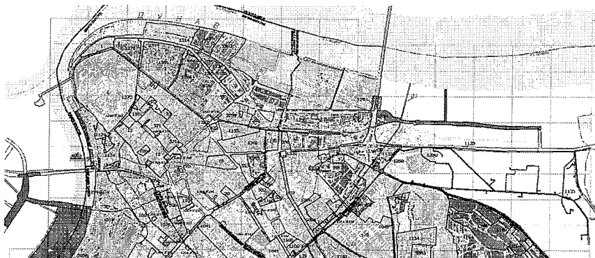
Спровођење плана, План генералне регулације грађевинског подручја седишта јединице локалне самоуправе – Град Београд (Целине I – XIX)

Предметне катастарске парцеле припадају површинама зоне детаљне разраде. Детаљна разрада се у овом случају спроводи непосредном применом правила Плана генералне регулације грађевинског подручја седишта јединице локалне самоуправе – Град Београд (Целине I – XIX) („Службени гласник Града Београда“, бр. 20/16, 97/16, 69/17 и 97/17), у складу са постојећим сепаратима као саставним деловима поменутог планског документа. Деоница 8, односно деоница на чијем се подручју разраде налазе поменуте предметне катастарске парцеле се простире од раскрснице Вишњичке улице и ул. Миријевски, чиме правац прелази из катастарске општине Палилула у катастарску општину Вишњица.